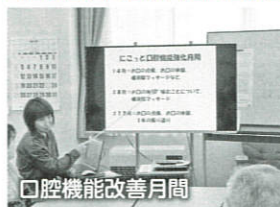
口腔機能改善月間

年に数回、栄養士や言語聴覚士にお越し頂き、栄養改善や口腔機能改善のプログラムも実施します