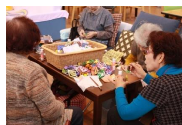
京極町デイサービスセンター