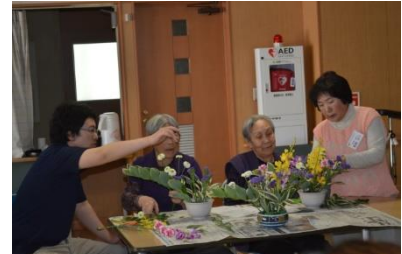
慶和園サークル活動