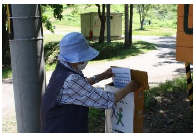
地域支援介護予防センター